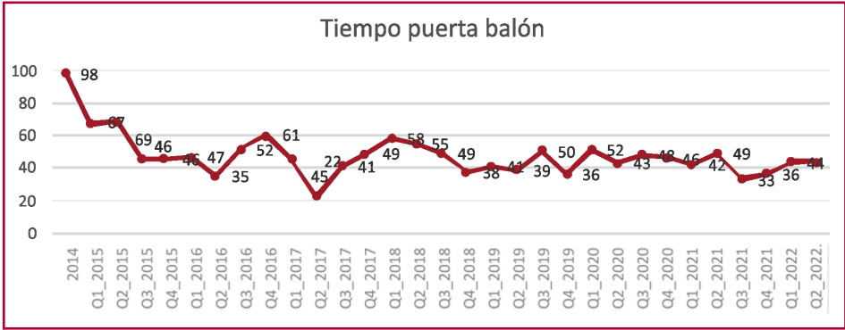
Fig. 1. Mediana de tiempo puerta balón (min) a lo largo del tiempo