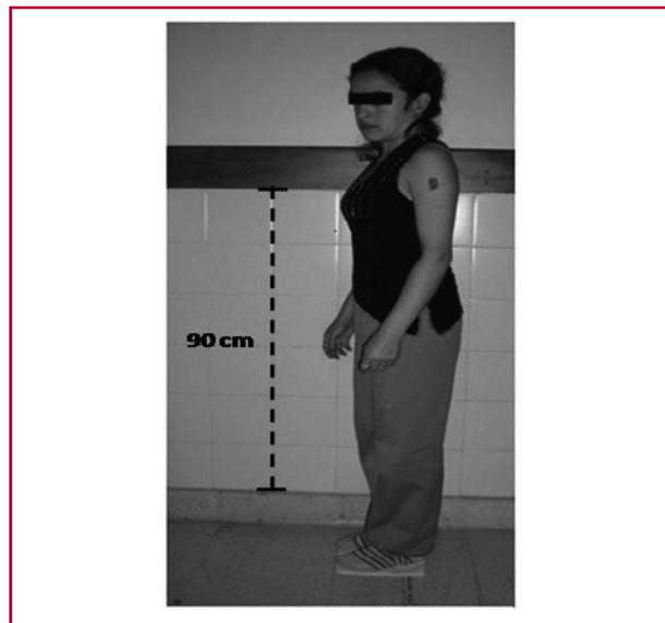
Fig. 2. Mujer de 26 años portadora de miocardio no compacto, con peso de 35 kg, altura de 1,35 m e IMC de 19.