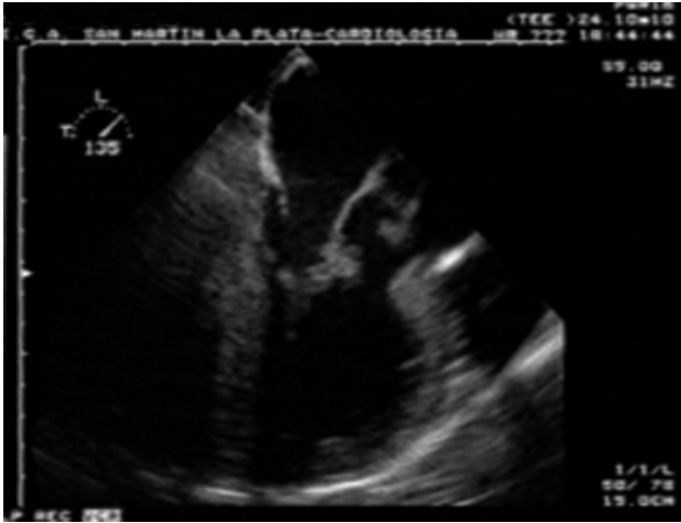
Fig. 1. Ecocardiograma bidimensional. Se observan vegetaciones mitroaórticas.