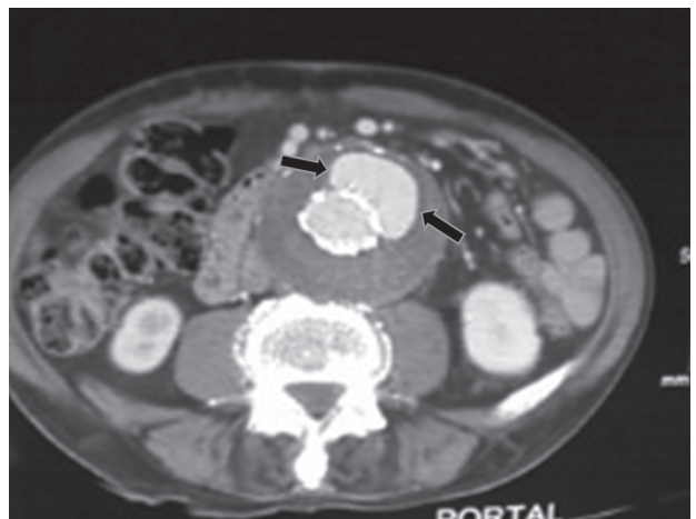
Fig. 2. TAC en fase portal. Entre las flechas se observa una imagen radiodensa correspondiente a la hemorragia en el interior del aneurisma.

Se consideran como causas: a) mala técnica quirúrgica y b) la angulación del cuello del aneurisma, calcificación y trombos murales. (2-4) El eco-Doppler es una técnica adecuada para el seguimiento sistemático de las endoprótesis aórticas, utilizando TAC de forma selectiva cuando los resultados de la ecografía no son claros. (4)